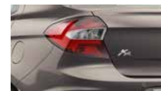
Cinza Copenhagem (perolizada)