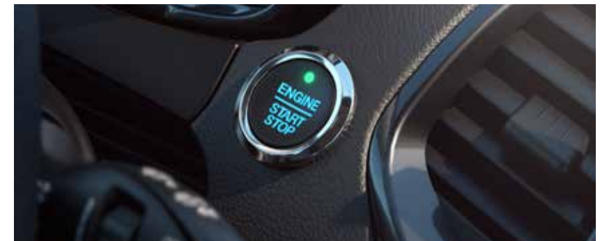
Ford Power – Partida sem chave