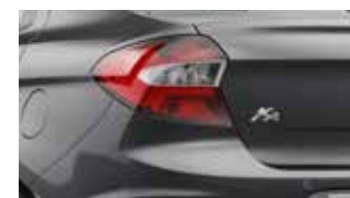
Cinza Moscou (perolizada)