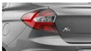
Prata Dublin (metálica)