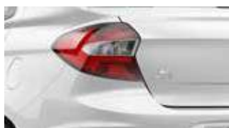
Branco Ártico (sólida)