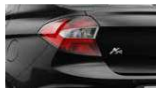
Preto Ebony (sólida)