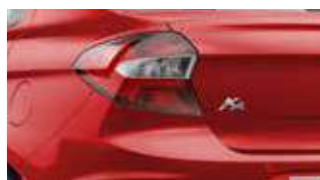
Vermelho Arpoador (sólida)