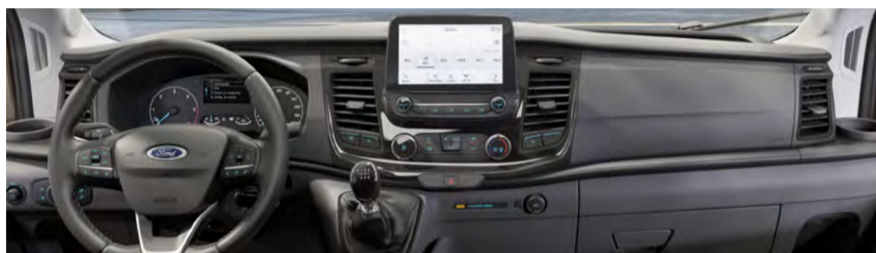
Mais conforto e dirigibilidade em conjunto com o Sync Move