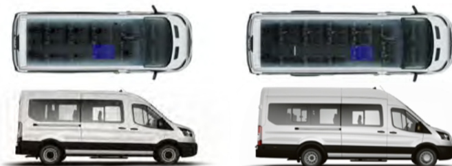
L3H2 versão Minibus com 14+1 /15+1 lugares e versão Vidrada com 2+1 lugares